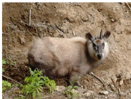
撮影地:岡野町 作品名:「だるまさんが転んだ」