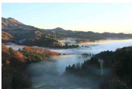
撮影地:上石黒(嶺の峠から) 作品名:「霧がたりないよ～」