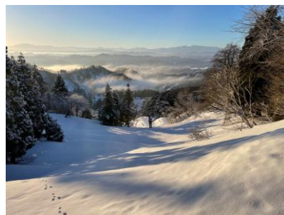
撮影地:黒姫山麓(板畑方面) 作品名:「柔らかな朝陽」