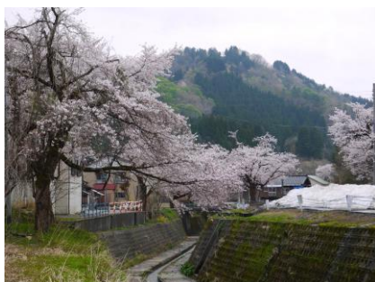
撮影者:中村和成 撮影地:岡野町 作品名:「仲倉川 山、桜、雪」