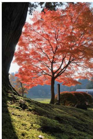
撮影地:荻ノ島 作品名:「後ろ姿」