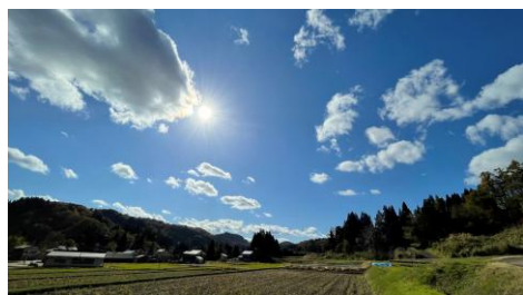
撮影地:門出 作品名:「青と緑」