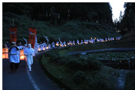
撮影地:栃ヶ原 作品名:「灯りの行列」