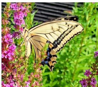
撮影地:岡野町 作品名:「ようこそわが家へ」