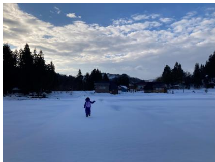
撮影地:荻ノ島 作品名:「冬の通園」